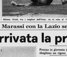
Atmosfera di trionfo a Marassi con la Lazio seccamente sconfitta (3-1) Genova, è arrivata la prima vittoria