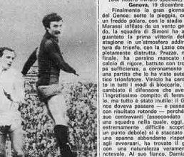
Genova. Prizzo segna di testa per i rossoblu al 51' con perfetta scelta di tempo (14')

Con un gol che fa Fiorentina giocare una bella, la Sampdoria si è vista a un livello ed è stata la partita di domenica scorsa.